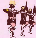
カラーガード隊演技