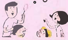
ジャンボしゃぼん玉作り体験